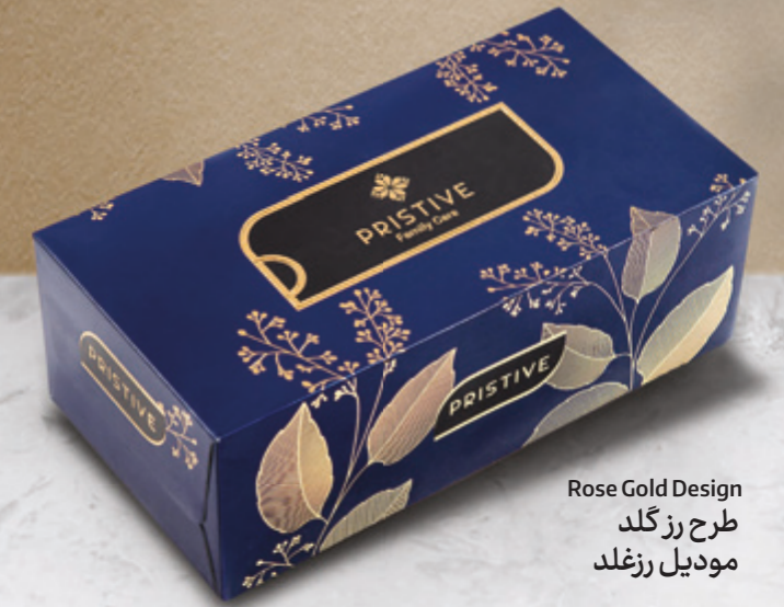
Rose Gold Design طرح رز گلد مودیل رزگلد