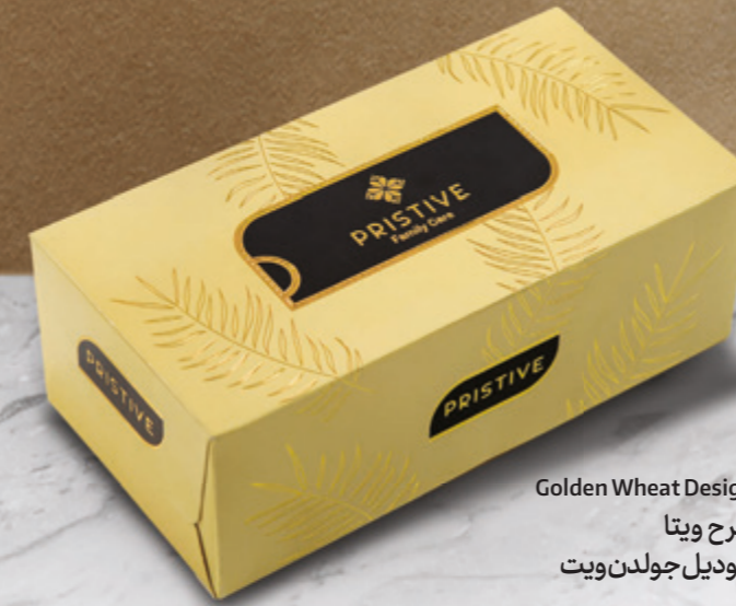
Golden Wheat Design طرح ویتا مودیل جولدن ویت