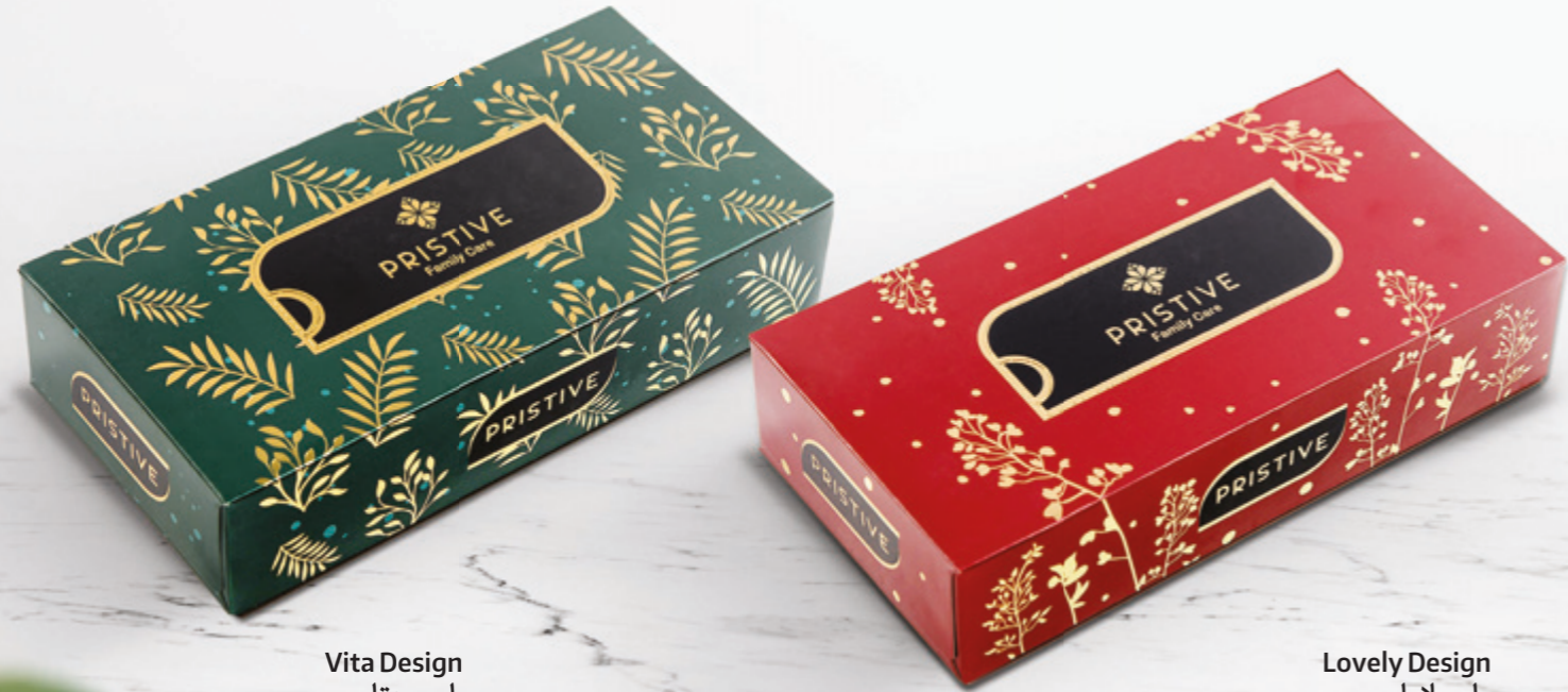
Vita Design طرح ویتا مودیل ویتا